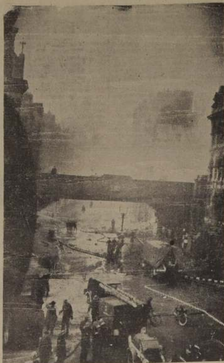
Una vista de Londres cuando la aviación alemana descargaba su furia contra la población civil. Pero la gloriosa Real Fuerza Aérea ha hecho pagar con creces los ataques de 1940.

El 15 de Septiembre de 1940 la R. F. A. quebrantó la blitzkrieg aérea, derribando 185 aviones alemanes