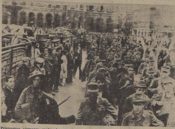
Prisioneros alemanes capturados en el avance británico en Bélgica, pasan por la calle de Antwerp. (Foto B.p.p.).