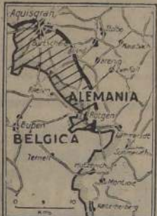
Mañana se espera que el S. E. de Aquisgrán, cuya caída es inminente. El sector achurado entre esta ciudad y Bélgica corresponde aproximadamente al territorio alemán ocupado en este frente por las fuerzas del general Hodges.

Se señala que al noreste de Praga quedan algunas posiciones en poder de los alemanes pero su desalojo se considera inminente. Su retirada permitiría flaquear la capital por ese