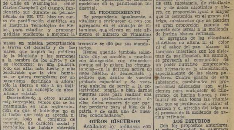
las clases trabajadoras, después de las luchas del siglo XVIII que fueran recibidas las palabras del Jefe del Gabinete.

S. E. el Presidente de la República ha comisionado al Consuegro Comercial de la Embajada