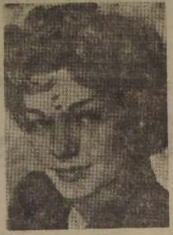
La estrella francesa Simone Signoret, protagonista de "Héroes Anónimos", presentada por J. Arthur Rank y distribuida por Universal-International, que va mañana al Plaza