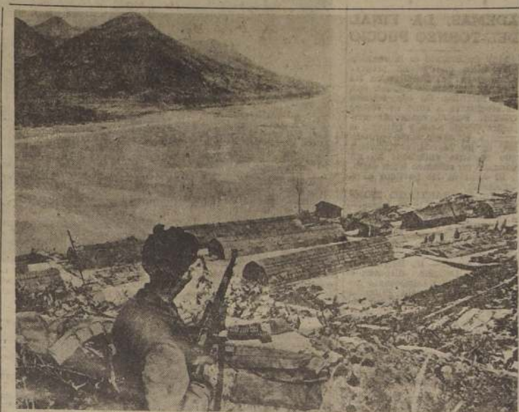
Un centinela de las Naciones Unidas, atrincherado en una colina, vigila la congelada superficie del río Imjin, para dar la voz de alarma a las tropas de la ONU.