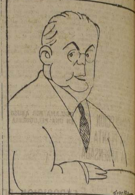
Warren Austin, delegado de Estados Unidos en el Consejo de la OEA, que ha obtenido un triunfo personal con el acuerdo de no interferir a China como nación agresora.