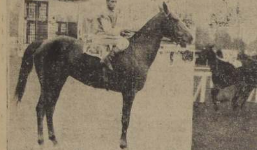
Katuska, conducida por L. A. Díaz triunfó sobre sus enemigos en el premio "Isabelino". La llegada de la prueba, en donde la escolaron Bergerac e Ibañeta

tra acostumbrada relación sobre el desarrollo de las diversas pruebas.