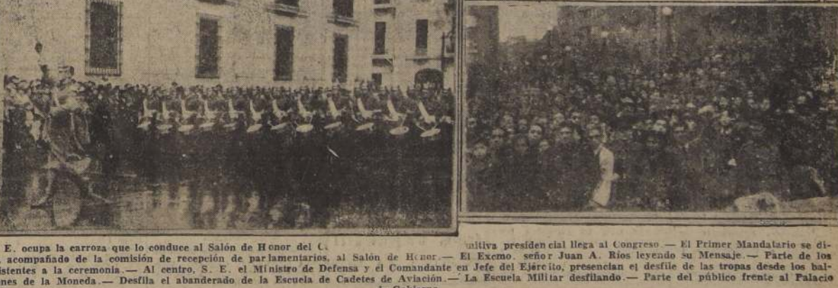
S. E. ocupa la carroza que lo conduce al Salón de Honor del C. ge, acompañado de la comisión de recepción de parlamentarios, al Salón de Honor. — El Excmo. señor Juan A. Ríos leyendo su Mensaje. — Parte de los asistentes a la ceremonia. — Al centro, S. E. el Ministro de Defensa y el Comandante en Jefe del Ejército, presencian el desfile de las tropas desde los balcones de la Moneda. — Desfila el abanderado de la Escuela de Cadetes de Aviación. — La Escuela Militar desfilando. — Parte del público frente al Palacio de Gobierno.