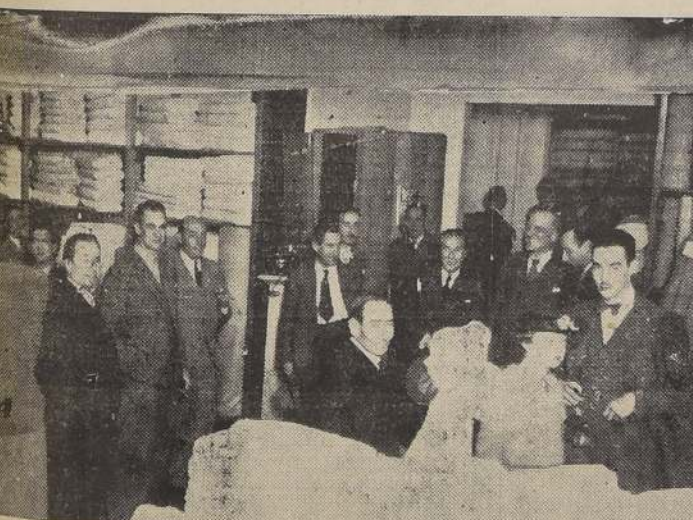
Un grupo de asistentes a la inauguración del local de ventas de "El Hogar", efectuada el miércoles en la tarde