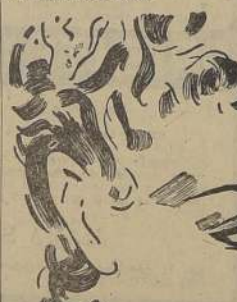
Fig. 1. A. — El niño flexiona los codos, (el zorro tiene las patas arqueadas), y se acerca así al suelo. Los brazos permanecen fijos, la cabeza se alza, y los hombros se acercan. El niño dice "aproxímame fuertemente"

Contra los párpados hinchados, y la aparición de pequeñas bolitas debajo de los ojos, he aquí un excelente remedio: Hacer hervir un vaso de vino tinto con una pequeña cantidad de pétalos de rosas. Dejar reducir hasta la mitad. Lavar los ojos y los párpados dos veces al día con este licor tibio.