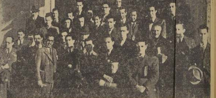
Grupo de estudiantes de Medicina que en la tarde de ayer realizó una provechosa visita a la Central de Leche de Santiago.

TRASLADO DEL HOSPITAL Desgraciadamente toda esta obra realizada por el Hospital Nacional está a punto de termi-