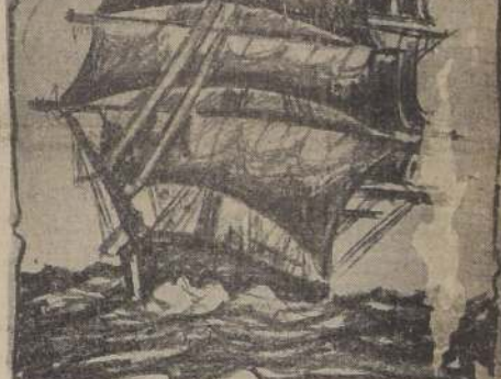
La esbelta y hermosa fragata "Lautaro", que arrió sus velas para siempre por culpa de la mano siniestra que destruyó otras naves chilenas, en su afán insensato de abatir la Democracia y la Libertad.