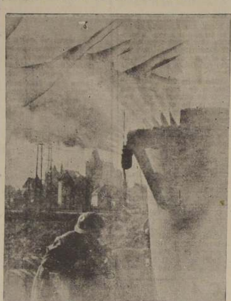
La más grande cortina de humo jamás tendida en toda la guerra oculta los preparativos británicos para la ofensiva del Rhin. Aquí tenemos el generador mecánico en acción.

Defensores del Ruhr en peligro de ser cercados al unirse las fuerzas británicas con las norteamericanas