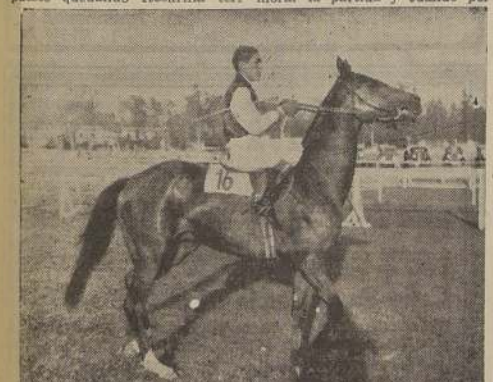
Pehuenco regresa al pesaje, después de su victoria en la Pola de Potrillos. Jockey: A. Vidal.

OCTAVA CARRERA A continuación de los clásicos tocó su turno al premio Barata, handicap sobre 2.000 metros, y que tuvo un interesante final entre Shanghai Lily, Haviland y Mojicon.