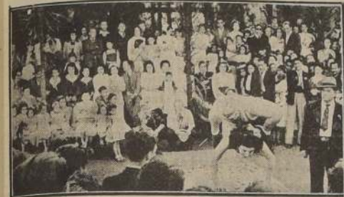
Artistas del Sindicato Circense que prestaron su generosa colaboración en los diversos hospitales, actuando en el Hospital San Luis