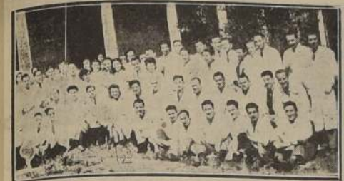
Doctores y estudiantes de medicina del Hospital San Borja