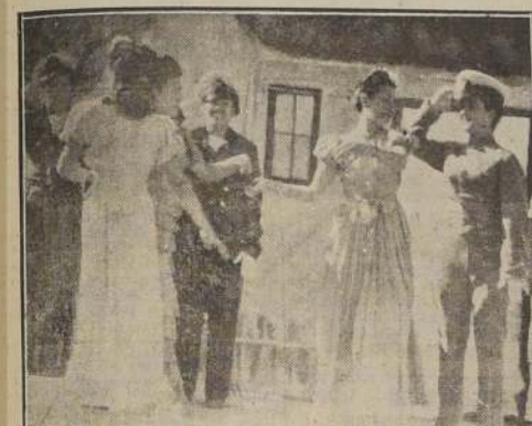
Conjunto artístico del Hospital Roberto del Río, durante la presentación de un cuadro de índole patriótica