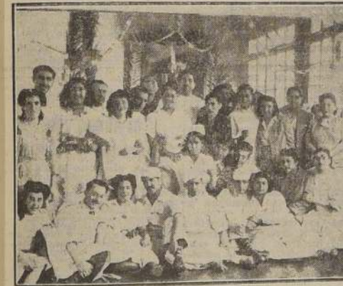
Grupo de enfermeras y practicantes del Hospital El Salvador