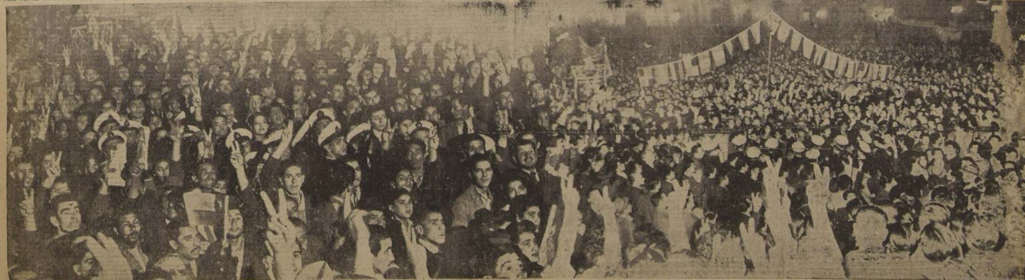
UNA PARTE DE LA MUCHEDUMBRE QUE PARTICIPO EN LA GRANDIOSA MANIFESTACION DE AYER

Asimismo concurrieron los sindicatos de la CTOH, organizados ya por fenecer, en contra de la barbarie y el despotismo fascista.