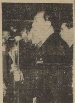
Don Julio Barrenechea, vicepresidente de la Cámara de Diputados, dirigiendo la palabra a la muchedumbre

Chile, republicano y democrático por tradición y por historia, recibió la noticia de la captura de la capital nazi con el entusiasmo con que este pueblo