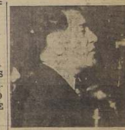
El Embajador de México haciendo uso de la palabra

Pero no nos durmamos sobre los laureles, no podemos adormecernos con el incienso de la victoria. Es necesario organizar la paz en forma tal y definitiva que haga imposible que nuestros hijos y los hijos de nuestros hijos atra-