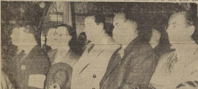
Parte del comando de la manifestación de ayer

Levantemos así todos unidos la antorcha que ha de iluminar el camino de libertad y progreso que han de recorrer los pueblos del mundo entero y al que estamos seguros habrán de incorporarse, sin excepción todos los pueblos libres de la América nuestra.