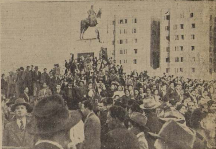
Manifestantes en la Plaza Baquedano antes de iniciarse el desfile

Recordó que la democracia tenía un papel de vital importancia que desarrollar en el futuro.