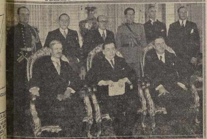
Después de la presentación de las credenciales del nuevo Ministro alemán

A mediados de ayer se llevó a efecto la ceremonia de presentación de credenciales del nuevo Ministro de Alemania en Chile, Barón von Schoen.