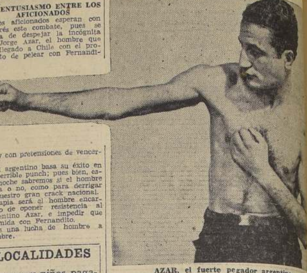
AZAR, el fuerte pegador argentino