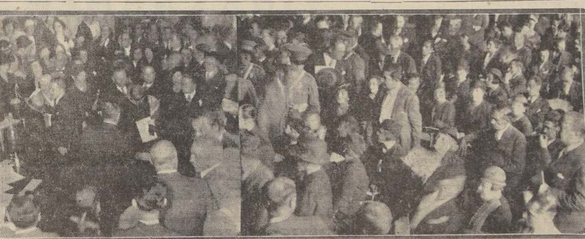
Aspecto que ofrecía la sala municipal, durante el acto de constitución del Colegio Escrutador Departamental