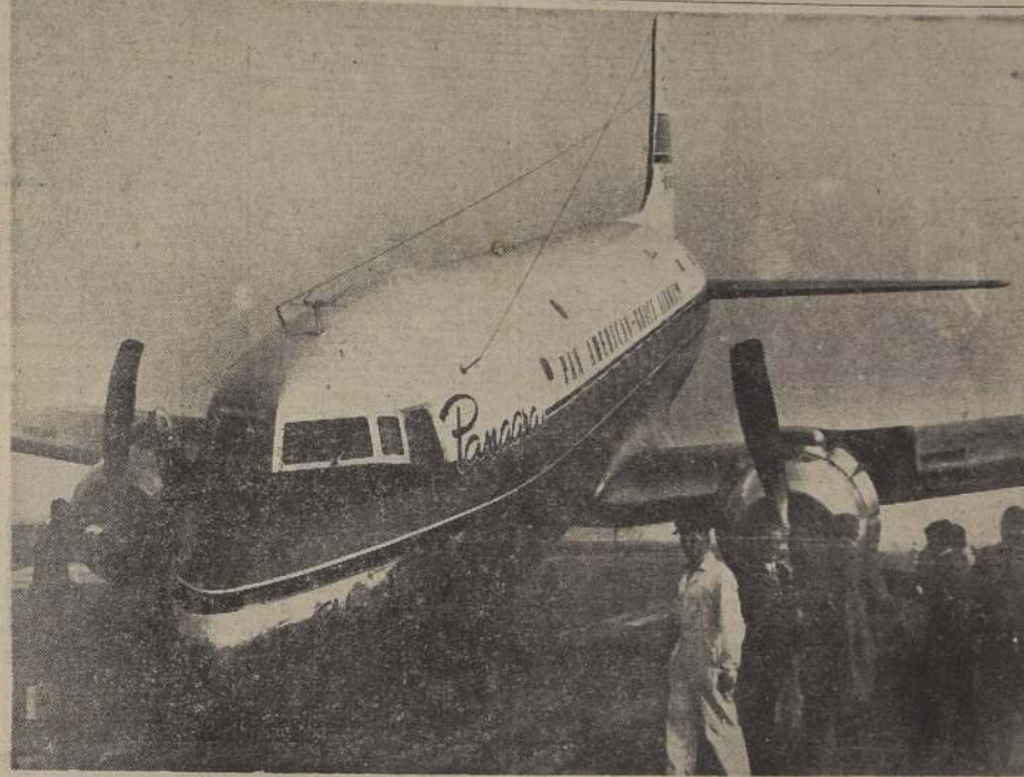
ASI QUEDO "EL INTERAMERICANO", EN LOS CERRILLOS.— En el grabado vemos la forma en que quedó sobre la pista de Los Cerrillos El Interamericano de la Panagra, procedente de Lima, aterrizado ayer luego de aterrizar, al fallarle la rueda delantera de su tren de aterrizaje. Sufrieron daños las hélices y la proa de la nave aérea. Tanto los pasajeros como la carga y correspondencia no sufrieron ninguna consecuencia. La pericia de los pilotos evitó que el accidente fuera de mayores proporciones.