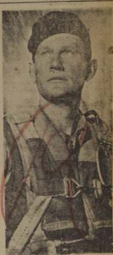
Wendell Corey, protagonista ALAS SOBRE EL PACIFICO, que estrena el viernes el Teatro Plaza, y que ha sido elogiada como la mejor película de aviación militar filmada hasta la fecha. Se distinguen también Forrest Tucker y Walter Bren- nan.

El interés despertado por el primer concierto de la tempora- da que dirigirá Sir Malcolm Sargent, y por las obras inclui- das, ha hecho que, con excep- ción de los palcos, se encuen- tren agotadas todas las plateas. Anfiteatros y galerías se pon- drán en venta el día mismo del concierto.