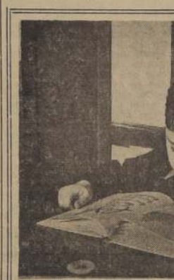
S. S. Pío XII

aquella Señora que tuvo la misión de poner el pan espiritual de los Angeles a nuestro alcance, haciéndolo carne y sangre en sus purísimas entrañas. Aquella que todos los días nos repite la invitación de sabiduría: "Et a generationibus meis implamini". "Corría a su oído el año de Gracia de 1511. Cuba, que había ya visto consagrado su suelo al ofrecerse por primera vez al Santo Sacrificio en el segundo viaje del Gran Almirante, iba a contar con la primera población estable en Baracoa. Y cuando Diego de Velázquez quiso ponerle un nombre, la llamó De Nuestra Señora de la Asunción." "Cuba es tierra de la Madre de Dios porque sobre ella reina como Patrona desde hace casi