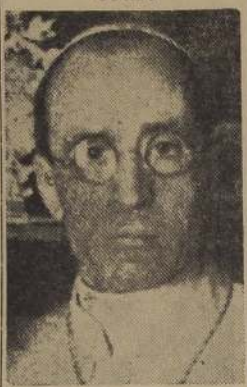
S. S. Pío XII