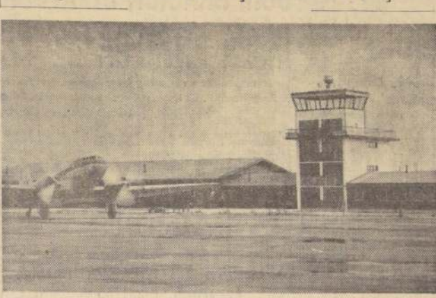
Vista parcial de las modernas instalaciones del aeropuerto de El Tepual, en la zona de Puerto Montt. Hoy será inaugurado en forma oficial.

Nuevas y continuadas bajas acusó ayer el precio del dólar de corredores. La cotización, ayer al mediodía, fue de $ 3.300 comprador y $ 3.330 vendedor. En la tarde arrojó las siguientes cifras: $ 3.270 comprador y $ 3.300 vendedor (precios promediados de todos los bancos de Santiago). Vale decir que el dólar, de la mañana a la tarde, bajó 30 puntos. Cabe recordar que, en relación con el día jueves, la cotización de la tarde de ayer significa una baja superior a los sesenta puntos.