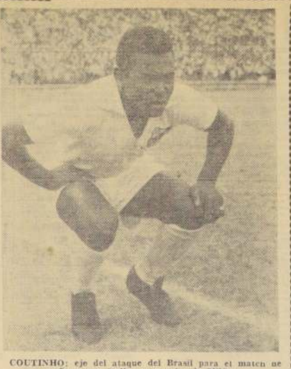
COUTINHO: eje del ataque del Brasil para el match de mañana con Italia, en cancha de Milán.

En el estadio de San Siro, que será el escenario del partido, está ya casi lleno. Se espera que el partido sea muy interesante.