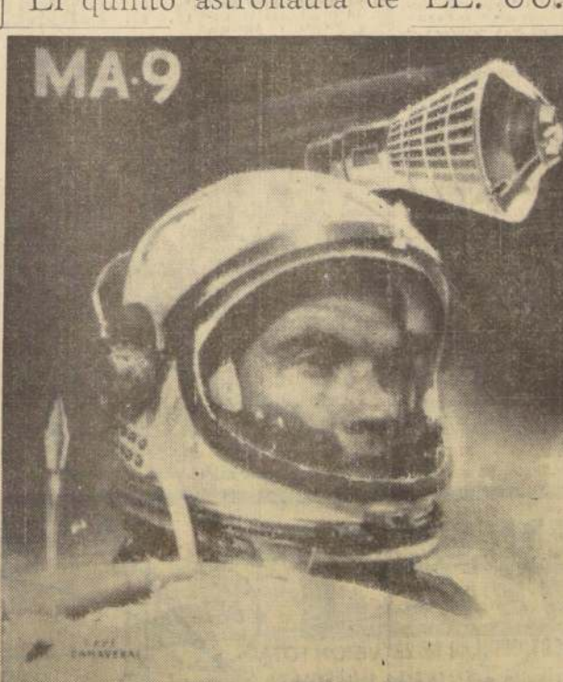
CAROL CASAVARÉ.— El astronauta Gordon Cooper, futuro quinto viajero espacial norteamericano, en un ensayo con la vestimenta que utilizará en su vuelo. De acuerdo con los proyectos de los científicos, Cooper debe ser lanzado el martes 14, en un vuelo de 22 órbitas en torno a la Tierra. (Radiofotografía UPI). —INFORMACION PAG. 10—