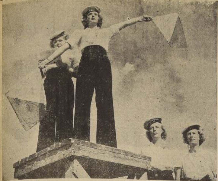
Estas simpáticas Wrens (miembros de la división naval femenina de la Marina Canadiense), se han especializado en el servicio de señales y comunicaciones. En el grabado aparecen enviando un mensaje por medio de banderolas.