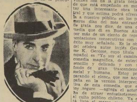
Ernesto Vilches, actor español, visitó ayer "La Nación".

Ayer tuvimos la grata visita del prestigioso actor español Ernesto Vilches, que se encuentra en Santiago desde hace algún tiempo. Se acaba de terminar su actuación en la película "La casa vacía".