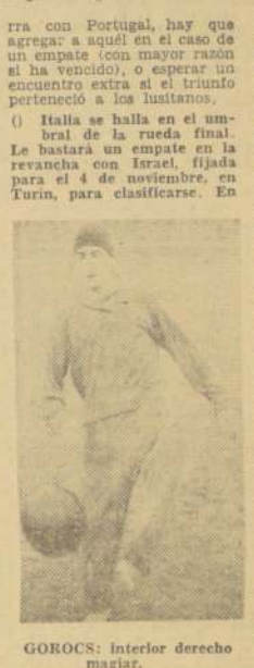
GOROCS: Interior derecho magiar.

La escala de premios para los jugadores ingleses, según informaciones proporcionadas por Walter Manning, es la siguiente: partido ganado, 12 mil pesos; partido empatado, 8 mil pesos; partido internacional, 180 mil pesos; cuando es transferido a otro club, 300.000 pesos por un año, 600 mil por dos años y 900 mil pesos por 3 años. Si forma en el cuadro campeón de la Liga, 300 mil pesos; si es vicecampeón, más o menos 270 mil, y si es tercero, 100 mil. En el caso de ganar la Copa, reciben 300 mil pesos cada uno. ¡Qué lejos quedan de lo que llega al bolsillo de Pelé!