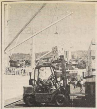
A más de 542 millones de dólares alcanzaron las exportaciones de Chile hacia Estados Unidos durante los primeros cinco meses del año.