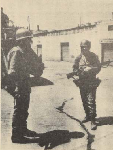
Soldados libaneses hacen guardia en una zona periférica de Beirut donde se han producido violentos enfrentamientos entre tropas del Ejército y musulmanes shiitas.

El tifón "destruyó totalmente" 3.350 hogares y "daño parcialmente" otros 10.898.