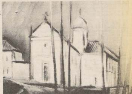
Seminario de Olinda, 1983

jan la vida de Ouro Preto, ciudad de grandes artistas cariocas