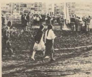
Un día esta rotonda fue inaugurada para convertirse en una área verde hermosa e importante para los vecinos. Hoy está convertida en un sitio sucio y sin futuro.