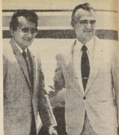
El Presidente de México, Miguel de la Madrid, saluda a la prensa junto con su invitado, el panameño Ricardo de la Espriella. Ambos mandatarios trataron diversos temas, aunque centraron el diálogo en la crisis centroamericana.

Se prevé que hoy la cifra de evacuados supere ampliamente al millar de personas. Frente al puerto de Salto, la medición llegó a primeras horas de hoy a 15,5 metros, marca alcanzada por primera vez desde 1959.