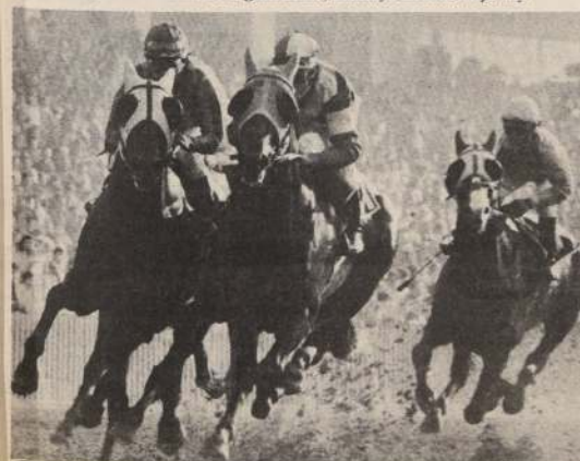
PURISIMO encabeza el lote de siete competidores en la prueba de 1.900 metros, en su primera pasada por la meta. A la larga el triunfo perteneció a "Soplónero".

"De todas formas. No hubo mucho que exigir esta vez porque la yegua venía fácil. Creo que en La Palma no la gana nadie", concluyó diciendo el jockey.