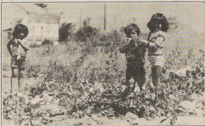
Las zonas despobladas adyacentes a ferias libres se transforman en basurales que afectan la salud de la población. Es uno de los problemas a cuya solución apunta el proyecto USACH.