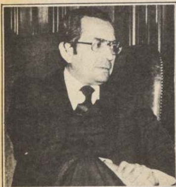
"Hemos superado la solicitud a la banca externa para disponer de líneas de financiamiento para el comercio exterior".

El programa de emergencia está dando frutos reactivadores, pues se enfrentó con absoluta realidad