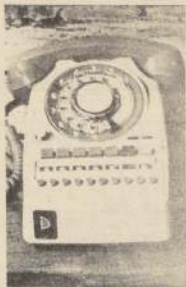
Los vecinos de La Cisterna piden líneas telefónicas a las compañías privadas.

Tengo entendido que las tarifas son iguales para cualquier comuna, y el costo de los teléfonos también, es por ellos que me sentiría muy informado si algún ejecutivo de estas empresas privadas puede respondernos por medio de LA NACIÓN.