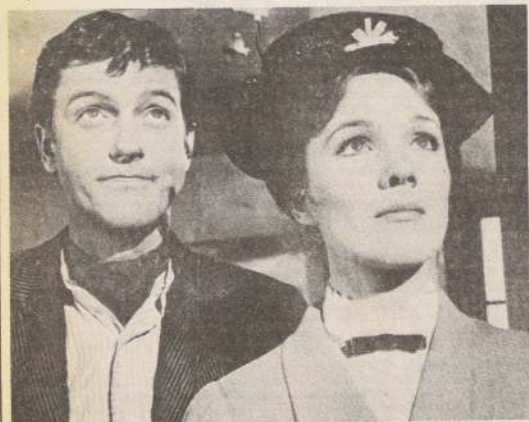
Dick van Dyke y Julie Andrews en una escena del filme "Mary Poppins".

Para los productores de cintas para niños ha sido de real avance el hecho de doblarlas al idioma del país donde se exhiben. Este ha sido el caso, ya que en la primera versión que llegó al país, la cinta estaba trabajada totalmente en