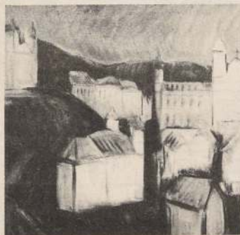
Paisaje de Ouro Preto.