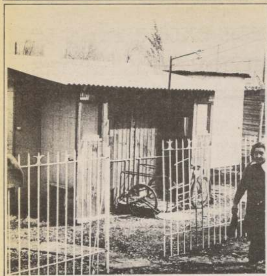
La caseta sanitaria marca el inicio de la urbanización. El segundo paso será la construcción de las habitaciones, que darán el carácter definitivo a los nuevos grupos poblacionales, dejando atrás la cruda realidad de los campamentos.