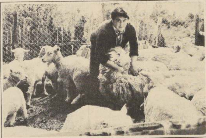
El 50 por ciento de la producción nacional de lana se exporta a los mercados internacionales.

Por otra parte, si el crédito de operación se adeuda desde 1981 o antes, entonces se ampliará el plazo para la cancelación de las cuotas a 4 años y la reprogramación será sobre el 90 por ciento de lo adeudado. Las cuotas se reajustarán según las UF y se aplicará un interés del 10 por ciento.