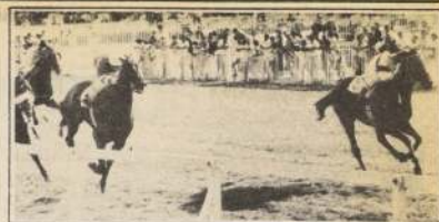
MAPALO (por fuera) puede conseguir triunfo en la segunda prueba clásica

Se espera una gran justa de este reducido lote, que denota calidad en sus filis, pues todos son animales de primera línea que darán calor de competencia a este Clásico "Invierno".