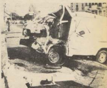
Los famosos "panes de molde" no respetan discos, pareceda el paso, luces rojas, amarillas o peatonales. He aquí una consecuencia: un muerto.