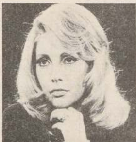
Jacqueline Andere es la protagonista de "Sandra y Paulina".