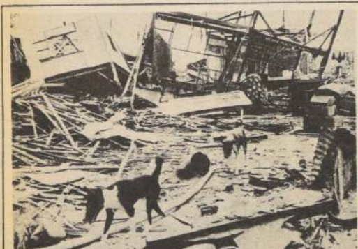
ORANI, FILIPINAS.—Aspecto de la destrucción de un pueblo costero de Bataan, luego del paso del tifón "Vera" y que causó la muerte de por lo menos 86 filipinos.

WASHINGTON, julio 17 (UPI).— El Presidente Ronald Reagan leerá un importante discurso sobre política exterior esta semana, especialmente sobre la situación en la América Central y en el Medio Oriente.