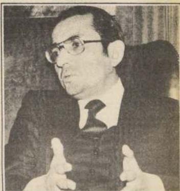
"Los agentes económicos necesitan de un marco estable para que puedan adoptar decisiones para el mediano y largo plazo".