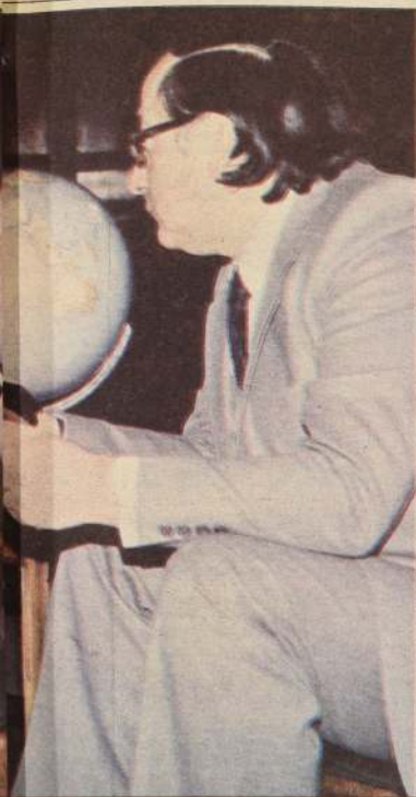
El Ministro de Hacienda, Carlos Francisco Cáceres concedió una entrevista exclusiva a La Nación analizando todos los temas de la actual coyuntura económica.