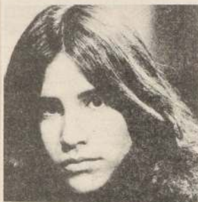
Gloria Pires encarna el personaje principal de "La Mezista".