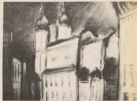
Iglesia de Sao Joao del Rey, 1983

Don Quijote y Gabriela Mistral en hebreo