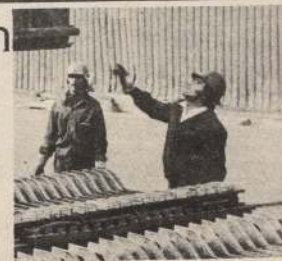
LOS INGENIEROS, iniciarán el estudio de factibilidad en explotación del cobre, en un análisis de comportamiento en el mercado mundial.