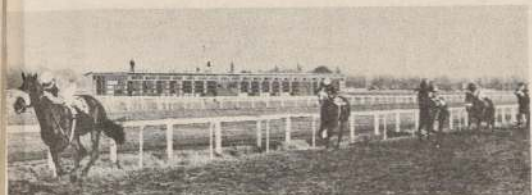
DIGNITE: En una demostración cabal de lo que puede dar, venció a sus similares en el Clásico "Arturo Lyon Peña", disputado ayer sobre 1.600 metros. "Asaldúa" llegó tercera a casi siete cuerpos de su hermana paterna.