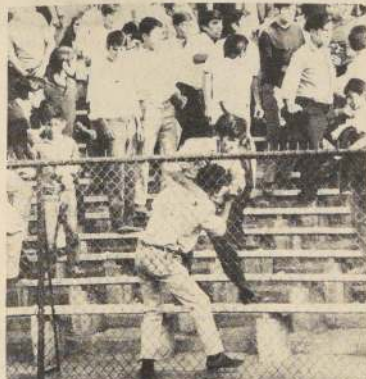
Las violentas riñas entre ebrios en los estadios son habituales a pesar de los controles en las puertas y subidas a las graderías.