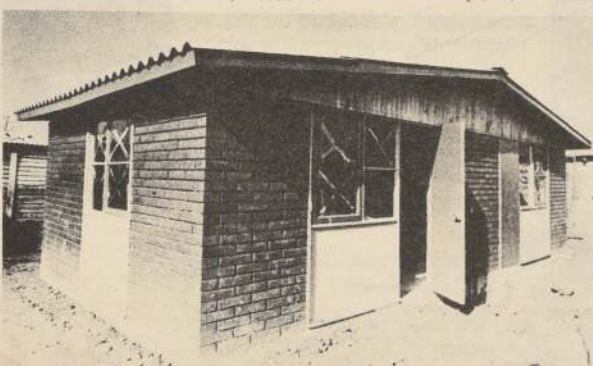
Decisión gubernamental: construir más y más casas para quienes tienen bajos ingresos.

Este nuevo llamado del Gobierno a licitación, para la construcción de estas 4.797 nuevas casas, respecto de las cuales se emplearán fondos sociales y sectoriales de los municipios, forma parte del plan general dispuesto por el ejecutivo, para aliviar al máximo el problema habitacional en el país, especialmente a los sectores sociales de más bajos ingresos.