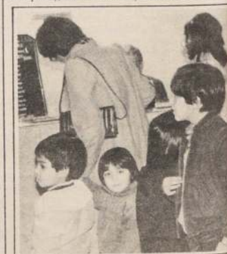
Durante cada invierno, las mamás dejan por dos semanas sus múltiples quehaceres domésticos para compartir con sus hijos gratas jornadas.

Las alternativas y los precios cubren, como puede observarse, las más variadas necesidades y todos los bolsillos, alcanzando los dos únicos objetivos perseguidos: diversión y combate al frío.