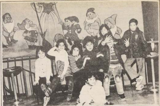
Mientras los pequeños esperan pacientemente que "Dumbo" les entregue su sano mensaje de amistad, el lente de LA NACION aprovecha de captar su alegría infantil.

No verlas de nuevo o simplemente ignorar que están en la cartelera es algo imperdonable por parte de los amantes al buen cine, especialmente cuando se trata de filmes para niños en vacaciones de invierno.