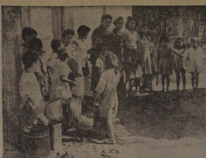
La escasez de agua potable es uno de los problemas vitales de comuna de La Cisterna. Los moradores han de realizar largas peregrinaciones para procurarse este líquido elemento. La foto, gráfica muestra en sus exactas dimensiones las características de este mal, que parece no tener remedio, en la Población San Ramón.

Los problemas que afectan al progreso y bienestar de cada sector así representado, como del mismo modo, a los demás postulados que constituyen la razón de ser del partido. Se así como, por ahora, en la lucha interna de elección de mesa directiva a verificar se el domingo 30 del actual, van como candidatos a dirigentes de la Asamblea Radical, representantes de las Poblaciones La Florida, El Polígono y Bolívar, que son importantes y progresistas centros poblados de esta comuna. (I.B.A. NEZ, correspondiente).