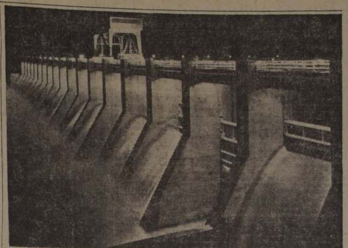
CHITTANOOGA, Tennessee.— Una vista nocturna de la famosa represa que riega el valle. El Presidente de Chile visitará esta obra a fin de estudiar el moderno sistema de distribuir las aguas. El señor González Videla tiene el proyecto de construir en su patria algunas represas de las que mostramos en la presente foto.

"La Prensa" dice que la abstención "se funda en cargos cuya comprobación demostrará cuán lejos está aquel país para obtener la pacificación de los es-