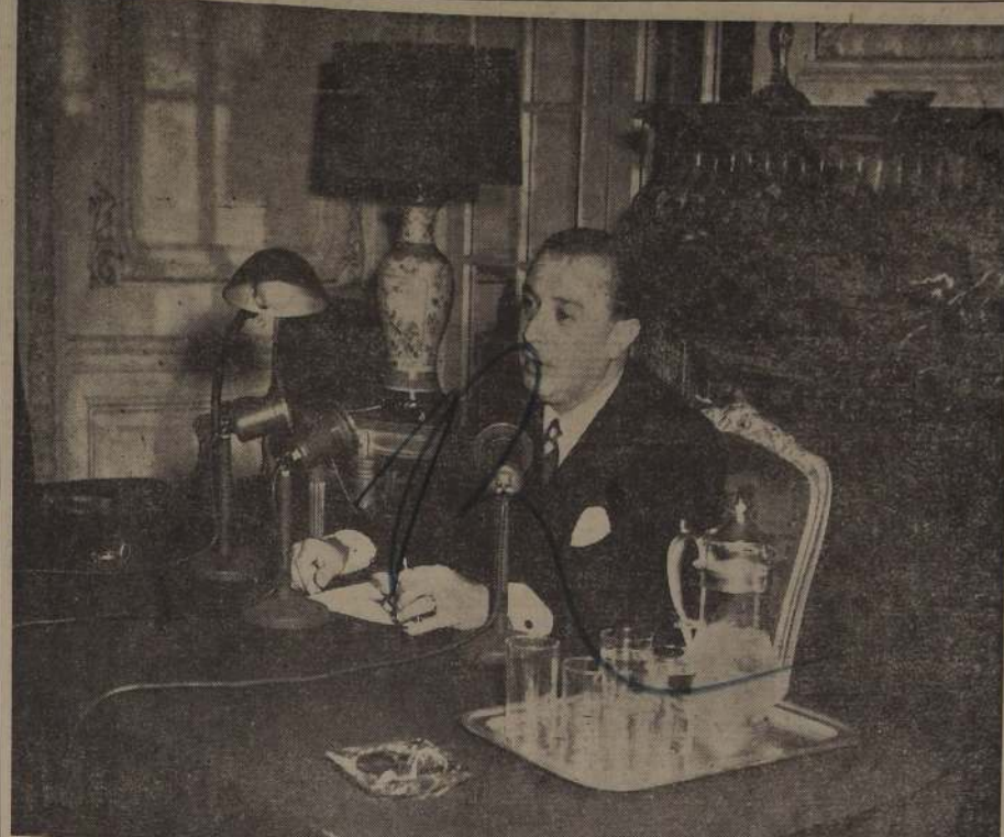
S. E. el Presidente de la República, señor Gabriel González Videla, dirige su mensaje el domingo último, al pueblo de Chile, desde sus habitaciones del Hotel Plaza de Nueva York, por medio de las instalaciones de la Compañía Internacional de Radio, y de la Compañía de Telefonos de Chile Cooperaron al éxito de la transmisión la Dirección de Informaciones del Estado y la Asociación de Radiodifusoras de Chile.