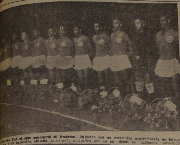
Unas 10.000 personas asistieron al partido. En primer plano, el equipo del América F. C. de Río de Janeiro, que ganó por 2 tantos a 0 al seleccionado de la Federación de Fútbol de Chile, número básico del festival realizado en el Estadio Nacional en homenaje al conjunto que dió el primer puesto a nuestro país, en el Campeonato Sudamericano de Fútbol efectuado en Lima.