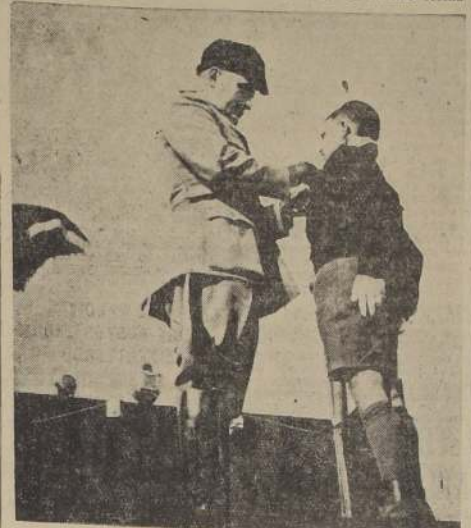
El Duce coloca sobre el pecho de un "Balilla" una me- dalla al valor civil

A la juventud, destinada a formar las nuevas generaciones italianas, ha dedicado el Duce la mayor atención, adecuando sus concepciones pedagógicas con la elevación de su espíritu, la atmósfera y las idealidades de la Revolución Fascista. Se educa a los hijos de la Re- pública, en efecto, moral y físic- amente, de modo tal que pue- dan seguir desarrollando, en to- dos los campos, la obra de los padres.