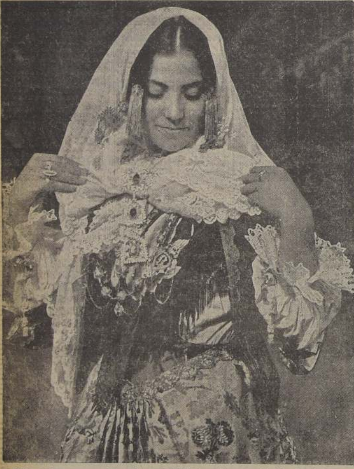
Las bellas mujeres morenas del pueblo sardo (Italia) se adornan en los días de fiesta con sus ricos y vistosos trajes tradicionales.