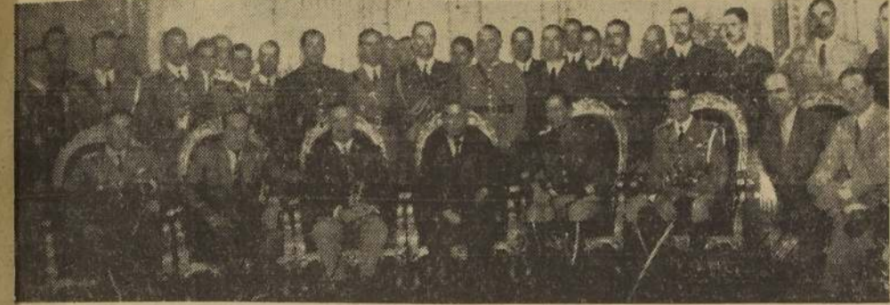
Los equitadores extranjeros durante la visita que efectuaron ayer a Su Excelencia, el Vicepresidente de la República

DESDE AYER SON HUESPEDES DE NUESTRA CAPITAL