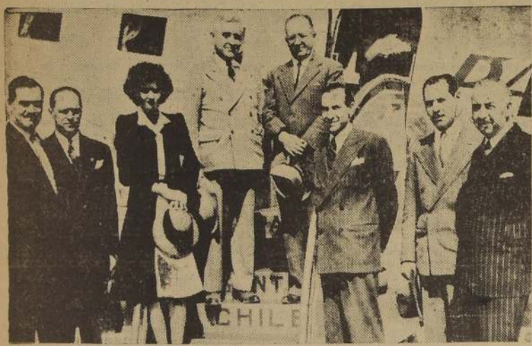
Funcionarios de la Panagra que llegaron ayer, procedentes de Buenos Aires, acompañados de las personas que le dieron la bienvenida en el aeropuerto