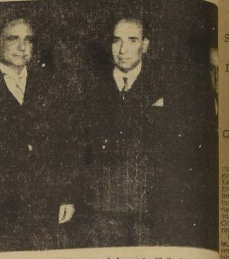
El Encargado de Negocios de la República Dominicana y el Agregado Civil, durante su visita a "La Nación"