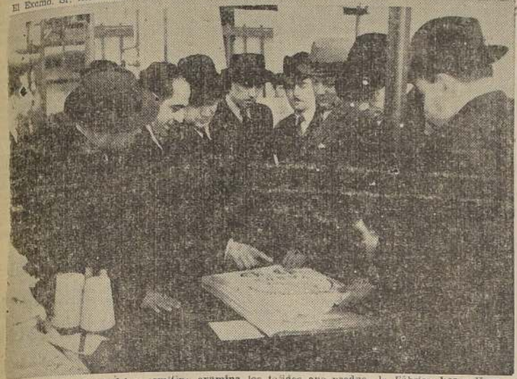
El Excmo. señor Alessandri y comitiva examina los tejidos que produce la Fábrica Yarur Hnos