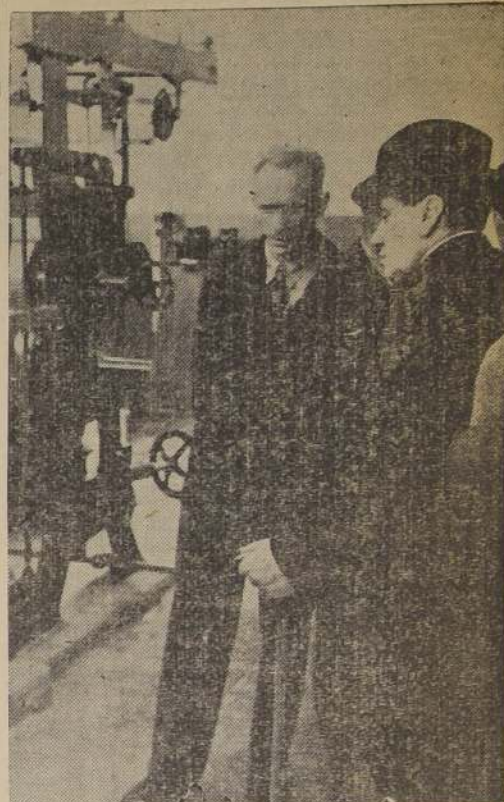
S. E. escucha las indicaciones que, sobre el funcionamiento de una de las máquinas le da uno de los técnicos