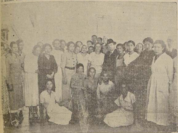
El Presidente de la República, rodeado de un grupo de operarias, durante la visita que practicó ayer a la Fábrica de Tejidos

compañía de los cuales recorrió detenidamente las diversas secciones del establecimiento.