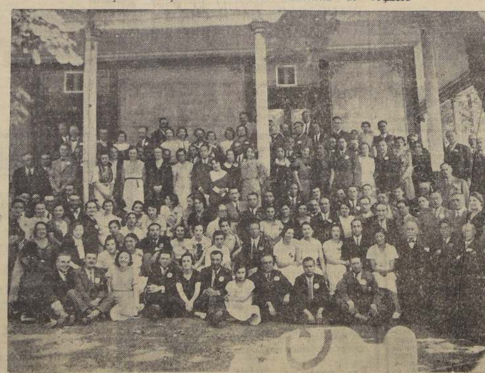
Asistentes al banquete de ayer en los Baños de Cauquenes, con motivo de la reunión rotaria intercitiadina.

El banquete de ayer. — Nume rosa asistencia de rotarios