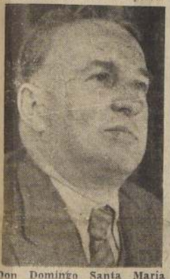
Don Domingo Santa María

Como se había anunciado, los maquinistas y cobradores de tranvías de la capital no concurren a su trabajo en las primeras horas de la mañana de ayer, razón por la cual la ciudad se vio privada