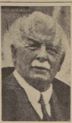
David Lloyd George

El choque entre Churchill y Hore-Belisha produjo un gran alboroto en la Cámara de los Comunes. Al referirse el primer Ministro a las críticas hechas