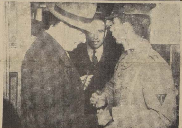
Un carabiniero desempeñando las funciones de maquinista de un tranvía del recorrido Av. España.

Tómese razón, comuníquese y publíquese. (Firmados): AGUIRRE CERDA — Arturo Olavarría B.