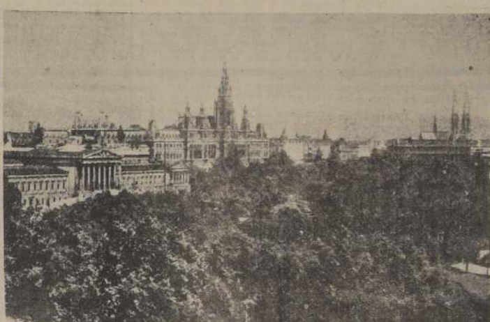
La Municipalidad y el Parlamento de Viena