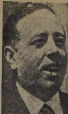
ROSSETTI: Mayor intercambio cultural.

El nuevo Embajador declaró al partir que se sentía "sumamente feliz" de desempeñar el cargo de representante de su país y que admira mucho la cultura de Francia. Agregó que como Ministro de Relaciones Exteriores y de Hacienda de su país, había tenido oportunidad de seguir de cerca la vida eco-