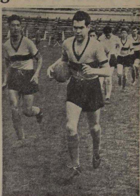
FERRO A LA CANCHA. — El conjunto surinero, encabezado por Climent, hace su aparición en el campo de juego, en una de sus últimas actuaciones. Hoy en Santa Laura, el team ferrobádminton libra un compromiso bastante incierto frente a Magallanes que anda por el fondo de la tabla, pero que está rindiendo con eficacia. Viene de sacarle un empate sensacional a Santiago. En el match de la primera rueda Ferro ganó a su adversario de esta tarde por cinco tantos contra uno.

De lo que se desprende que los futbolistas tienen razón cuando dicen que ellos prefieren jugar en el extranjero y no en Chile. Porque el público chileno es muy exigente con los de casa.