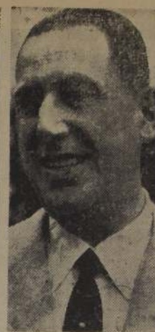
PERON: Independencia económica e industrial.

hecho ya, en el orden interno como en el internacional, una paz que no hemos pedido nosotros sino que la han pedido los demás, satisfaciendo así, por lo menos, el orgullo de todos los que luchan. Y pensamos que todo aquello que fué hasta ahora oposición y guerra económica, pasará a ser todo lo contrario. Yo tengo la inmensa satisfacción que puede tener un soldado y un argentino, de haber llegado a esto sin haber tenido necesidad de sacrificar ni la dignidad ni los intereses de la nación. Terminó el General Perón este importante discurso así: la situación del mundo dentro de veinte años, según puede perfilarse de la actual, va a ser extraordinariamente difícil para los países que no puedan tener una absoluta independencia en sus medios para hacerse valer como gran potencia en cualquiera de las obras que se le presenten. Yo creo que en veinte años la Argentina será una grande y respetable potencia, si todos nos ponemos a trabajar para fortalecerla y en grandeceria en la medida más extraordinaria que podamos pensando que tenemos en potencia, de la cual nosotros, haciendo que esa riqueza en potencia se ponga cuanto antes en presencia y utilización para hacer más fuerte a nuestro país y más feliz a nuestro pueblo.