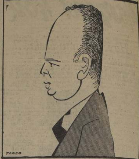
FELIPE HERRERA, Ministro de Hacienda. — Ha sido felicitado por el presidente del Banco Internacional, "por la buena labor que está realizando"