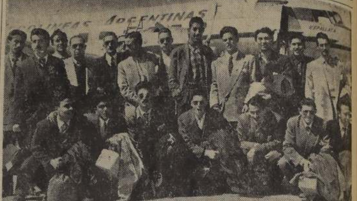
EN EL ESTADIO POPULAR ALONSO E HIJOS se presentará mañana en la tarde el conjunto del Club Atlético Juventud “4 de Junio”, de Mendoza, el que, además, cumplirá presentaciones en Maipo, Cunaco y San Vicente de Tagua-Tagua. Su rival del debut será el cuadro combinado de Juventud Atlético Renovación y Laboratorio Chile, el que constituye una verdadera selección de la 4.ª comuna. En la nota gráfica aparecen los jugadores argentinos a su llegada al aeropuerto de Los Cerrillos, donde se les brindó un cordial bienvenida. Este encuentro internacional ha sido fijado para las 17 horas, estando precedido de dos preliminares.

LOS CAMPEONES DE FUERZA LIBRE. — La prueba básica del programa se iniciará, según lo proyectado por los organizadores, a las 16 horas, y se definirá sobre 15 vueltas. Los coches largarán en paradas y cada 80 segundos entre ellas.