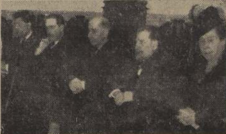
La mesa directiva en el acto de ayer en la Universidad de Chile, organizado por el Departamento de Extensión Cultural.