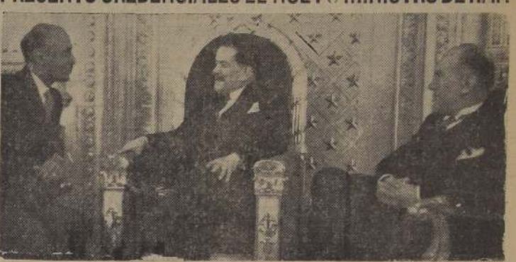
S. E. el Presidente de la República conversa con el Ministro de Haití, Excmo. señor León Laleau.