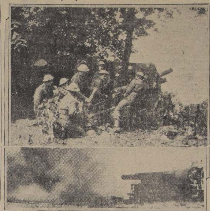
Inglaterra, que no sufre invasiones desde los tiempos de Guillermo el Conquistador (1066), extrema ahora sus medidas defensivas a fin de ponerse a cubierto de la tan anunciada "guerra relámpago". Con este objeto han sido reforzadas las baterías de costa; se han levantado trincheras de sacos de arena en las playas; se han montado baterías de campaña y anti-aéreas en todos los sitios estratégicos, y se han aprovechado todas las eminencias del terreno para emboscar grupos de ametralladoras y carros de asalto.