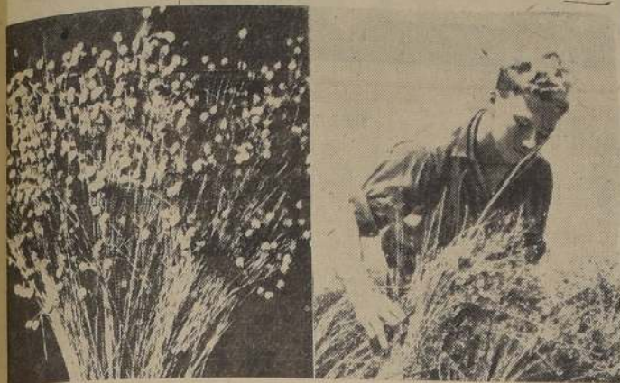
Diez semillas están encerradas en el fruto que es una cápsula oblonga. Se toman grandes manojos de plantas cosechadas a mano.

El lino es una planta de corto periodo vegetativo, (120 a 150 días). En su cultivo se distinguen dos variedades principales: de invierno, que se caracteriza por sus semillas redondeadas, de color rojo y flores blancas, tallos cortos y gruesos, y de primavera, que tiene semillas alargadas, de color rojo y flores blancas, tallos largos y finos, y flores amarillas. Entre nosotros se cultiva el lino de invierno, que es el más adecuado para cosechar la semilla. Para cosechar la semilla, se debe cortar la planta a la altura de la zona central, la mejor época es en mayo, cuando se trata de su cultivo para fibra, en la región sur se siembra en primavera, en la zona central de 12 a 18 cms. Se debe elegir la calidad del suelo, se necesitan de 130 a 150 kgs. de semilla por hectárea.