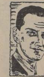
H. VIDELA LIRA. Motor de la Minería Nacional