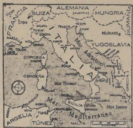
Escenario de las victorias aéreas aliadas y de una posible invasión