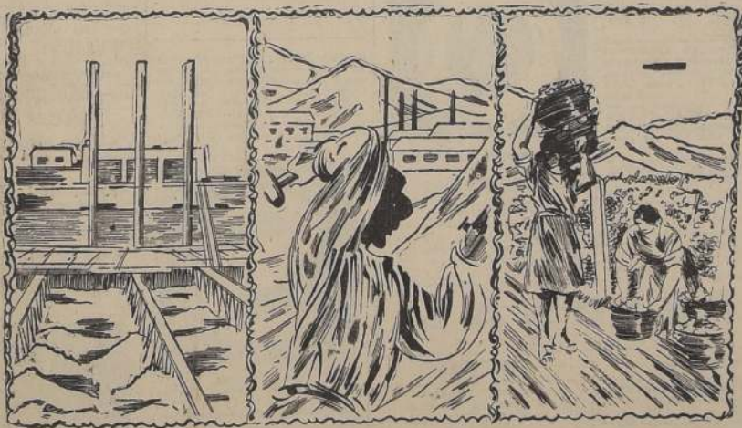
El trabajo en las minas

¡¡Allí todos los libros tienen descuento!!