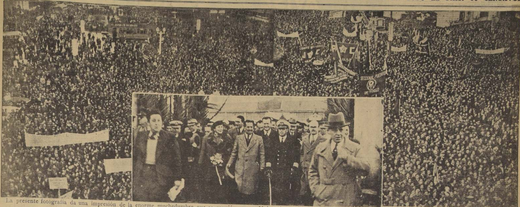
La presente fotografía da una impresión de la enorme muchedumbre que se reunió ayer en Valparaíso para exteriorizar al Excmo. señor Aguirre Cerda, el unánime apoyo del pueblo a la política de su Gobierno. — Al centro aparece S. E. al desembarcar para dirigirse a la Intendencia