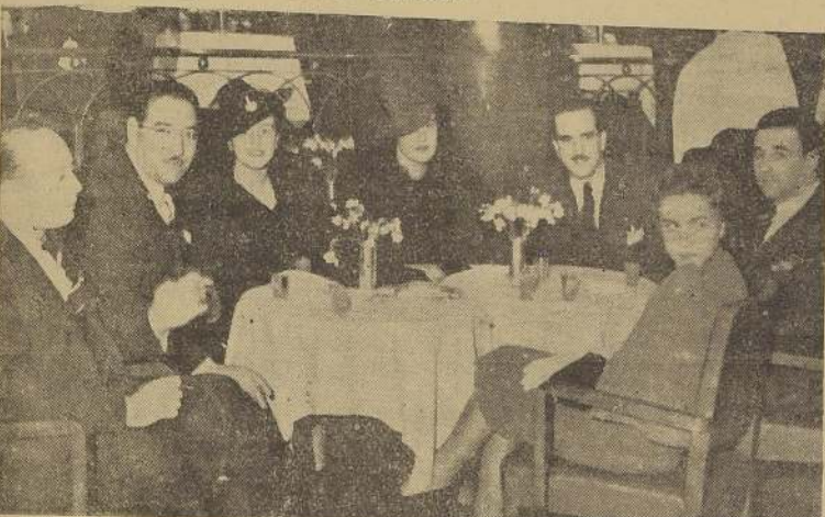
Una mesa durante el cocktail ofrecido ayer en el Tap Room Ritz con motivo de la reapertura del establecimiento.