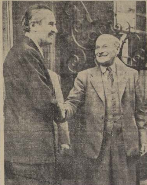
AYERELL HARRIMAN EN LONDRES.— Londres.— El Primer Ministro británico, Clement Attlee (derecha), saluda afectuosamente a W. Averell Harriman, enviado especial del Presidente Truman. Harriman visitó Londres después de celebrar conversaciones con los miembros del Gobierno de Irán, sobre la disputa petrolífera anglo-iraní, para llegar a una solución pacífica.

4.— Las utilidades de la nueva compañía se repartirían proporcionalmente por partes iguales.