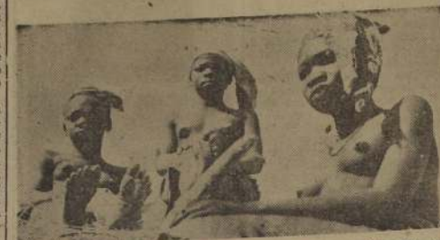
He aquí una realista escena de la película "Congo Salvaje", que exhibe el rotativo Opera. Es un film impresionista por su objetiva veracidad. Las vistas fueron tomadas por una expedición científica enviada por el Gobierno francés

Esta impresionante escena, corresponde a "Congo Salvaje", el interesante film que está proyectando el cine Opera con la más amplia aceptación de parte del público. Se nos encarga advertir que actualmente se están