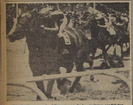
TADRAN, pase a los kilos, es uno de los mejores candidatos para ganar su compromiso de la tarde.