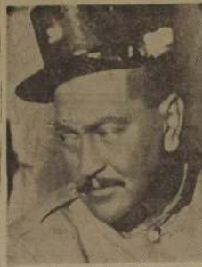
Personajes de la vida mexicana aparecen en "Maclovia"

Un triunfo de positivo valor consigue Maria Felix en "Maclovia", la producción que Pel. Mex. estrenó el martes en el cine Santiago, y que en el certamen de cine, celebrado recientemente en Venecia, logró una medalla de oro.