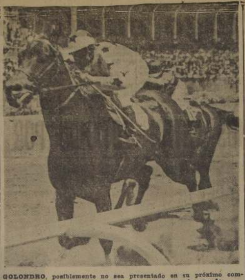
GOLONDRRO, posiblemente no sea presentado en su próximo compromiso, pues reventó en sangre en el curso de uno de sus últimos ejercicios.