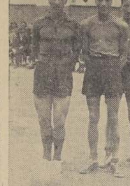
La delegación de Coquimbo, que mañana debuta en el campeonato, contra el cuadro de Santiago

SANTIAGO CONTRA COQUIMBO. Coquimbo cumple mañana un compromiso serio. Los muchachos de Coquimbo.