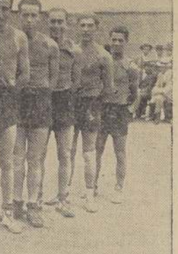
La delegación de Coquimbo, que mañana debuta en el campeonato, contra el cuadro de Santiago

SANTIAGO CONTRA COQUIMBO. Coquimbo cumple mañana un compromiso serio. Los muchachos de Coquimbo.