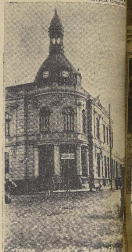
El edificio de Correos y Telégrafos de Temuco.