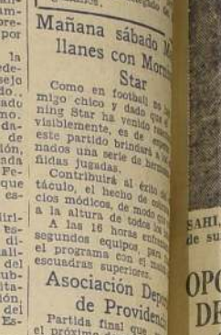
La delegación de Coquimbo, que mañana debuta en el campeonato, contra el cuadro de Santiago

SANTIAGO CONTRA COQUIMBO. Coquimbo cumple mañana un compromiso serio. Los muchachos de Coquimbo.