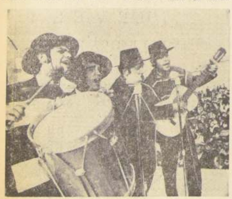
"Los de la Escuela", en una de sus exitosas presentaciones en el Festival Latinoamericano celebrado en Quito, donde obtuvieron el primer lugar en interpretación vocal.

No dudamos que las experiencias internacionales adquiridas por "Los de la Escuela" les han otorgado una madurez profesional tal que les permitirá ser —realmente— uno de los números más destacados del Décimo Festival de la Canción de Viña del Mar, donde competirán en categoría folklorica con el tema "Atacama en San Pedro", del autor Enrique "Kiko" Álvarez. "Los de la Escuela" están cuidando todos los detalles para que el certamen viñamarino sea su consagración definitiva en Chile.