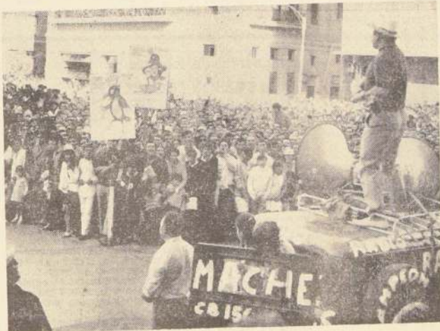
ASI ACTUO LA BARRA

En verdad, creemos que Chile confía en que Wanderers podrá realizar una actuación que prestigie al fútbol chileno. Por eso igualmente se reforzará el plantel. Más aún cuando se sabe que uno o dos extranjeros que actualmente militan en la tienda catrura serán sacados y se trata lógicamente de evitar sucesos desagradables para la temporada 1969.