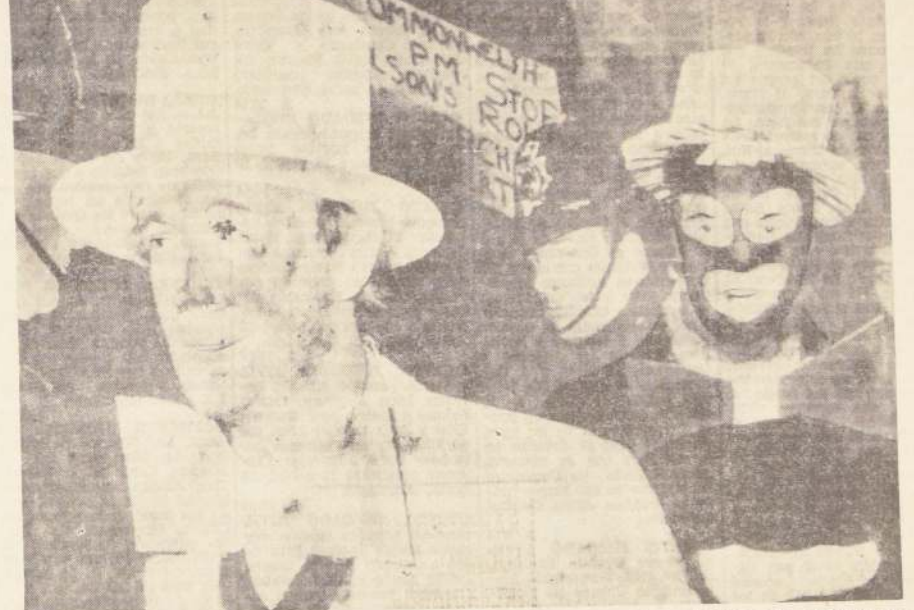
LONDRES.— Manifestantes vestidos de blanco y negro, realizan maniobras alrededor del edificio que sirve de sede a las conversaciones de la Conferencia del Commonwealth, que se realizan en esta ciudad.

retener los envíos de piezas de repuesto a Israel en el último fin de semana.