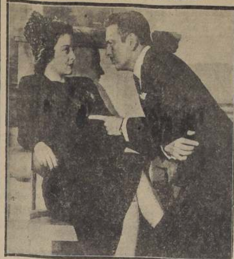
"Tribunal de Justicia" es la película sorprendente en la que el director, ha llevado a la pantalla un drama profundamente humano. En esta cinta de Cinematografía Ibarra, el espectador se mantendrá en tensión desde la primera a la última escena, ya que todo lo que sucede en su trama es de un interés extraordinario.