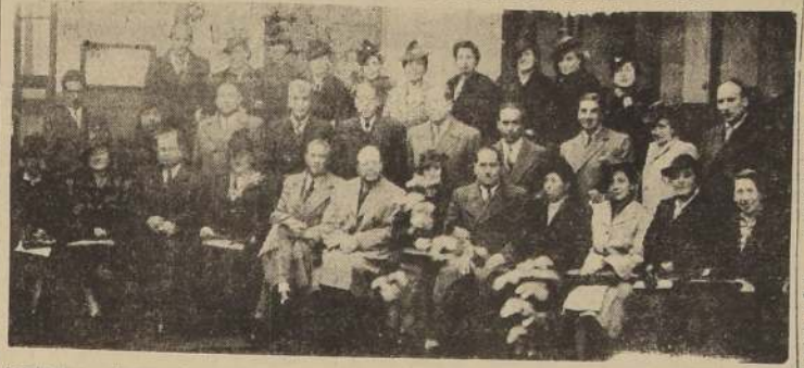
Asistentes a la reunión inaugural de la Convención de Profesores de Escuelas Normales

DEFENSA DEL PROYECTO ECONOMICO DE LA "UPCH"