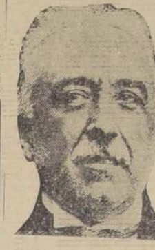
Alcalá Zamora, primer Presidente de la Segunda República.

LONDRES, 5. — "Daily Express", dice editorialmente que se desarrolla una lucha abierta entre el fascismo y el comunismo en España. "Sea cual fuere el resultado de la lucha, el régimen liberal republicano está condenado a morir. Veremos una nueva inquisición española". — (U. P.)