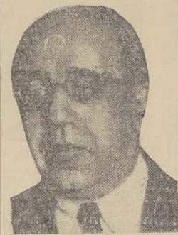
Manuel Azaña, la eminencia gris en la situación actual?