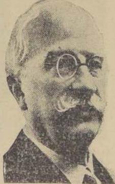
Alejandro Lerroux, contra cuyo Gobierno es el movimiento