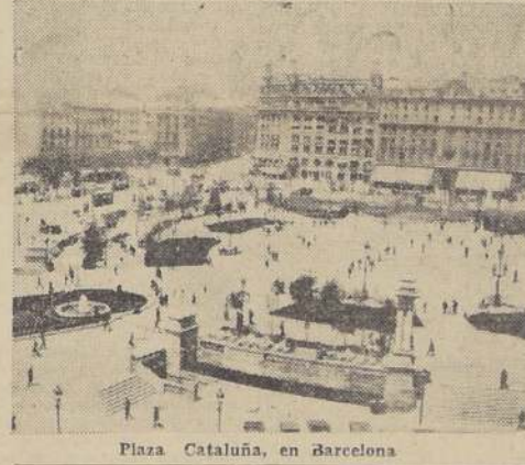
Plaza Cataluña, en Barcelona

VIGO, 5. — A las 13 horas comenzó la huelga general en toda la provincia de Pontevedra. Las comunicaciones con el resto de la Galicia se hallan cortadas. — (U. P.)