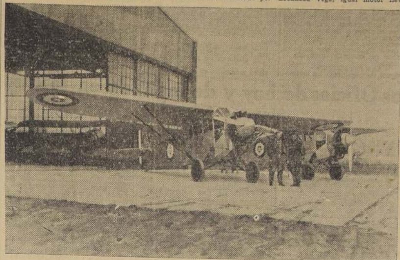
Los dos aviones. (Fotografía tomada en los Estados Unidos). El avión norteamericano Lindbergh el año 1927, en un avión Ryan, la travesía hecha en un aeroplano "Bellanca", desde Nueva York a Alameda, por Chamberlin y Levine, el mismo año, el vuelo del avión "América", del Comandante Byrd, desde Nueva York a las costas de Francia, la del capitán Hubert Wilkins, desde Alaska por sobre el Polo Norte, hasta el Spitzbergen, en un avión Lockheed Vega, igual motor llevan.

Los dos nuevos aviones para el servicio postal llegaron ayer a la Aduana de Valparaíso. Los aviones son de la Wright Aero-Engine Corporation (W.E.E.C.) y tienen motores iguales al del avión en que Lindbergh atravesó el Atlántico.