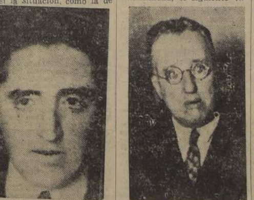
Don Juan Antonio Ríos, presidente del Partido Radical, cuyas declaraciones sobre la posición de la colectividad que dirige pueden dar nuevas orientaciones en el campo político. </

En vista de los estrechos lazos italo-alemanos, del eje Berlín-Roma y de la cooperación ante el problema español, se estima, con naturalidad, que Alemania haya establecido un almacén de municiones en Italia.