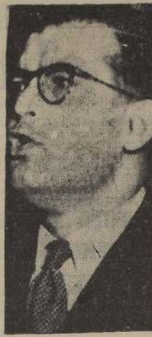
RADOMIRO TOMIC, presidente de la Falange, analiza las elecciones del domingo

—Fundamentalmente, a la vitalidad de la interpretación de la realidad chilena que repre-