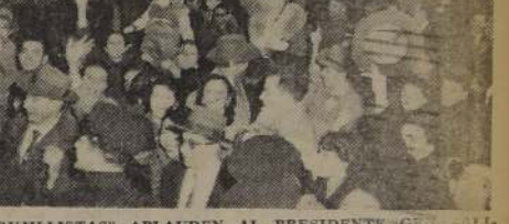
"TRUJILLISTAS" AFLAUDAN AL PRESIDENTE GENERALISIMO TRUJILLO. — NUEVA YORK. — Mientras un grupo de contrarios del ex Presidente dominicano realizaba una manifestación de protesta por la presencia del generalísimo Rafael L. Trujillo en el seno de la NU como delegado jefe, grupo de partidarios lo aplaudió a su llegada al edificio de la organización mundial para celebrar la reanudación de las sesiones de la Séptima Asamblea General.