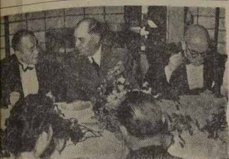
MARISCAL FRANCES JUIN EN TOKIO. — Tokio. — El ministro japonés Shigay Yoshida, el mariscal francés Juin y el ministro de Relaciones del Japón, Kato, asistieron a un banquete dado por el embajador francés en honor del mariscal, que visitó Tokio en febrero.