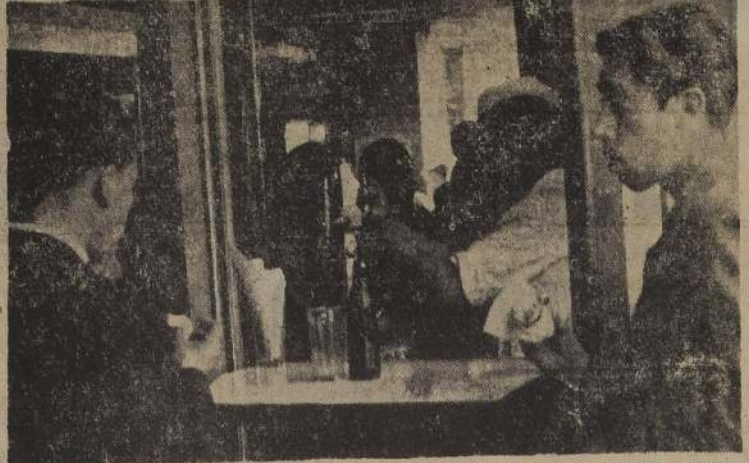
CENTROS DE ESPECULACION. —La mayor parte de las fuentes de soda, especula impunemente con los precios de las bebidas gaseosas. Pese a la nueva lista de precios ordenada por el Ministerio de Economía y Comercio, estos locales siguen cobrando precios diferentes ante los indigentes reclamos de la población.

Ford modelo 50, desde los alrededores del Teatro Oriente.