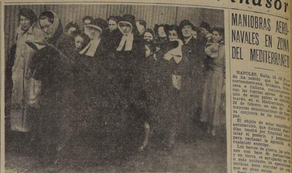
MONJAS CATOLICAS BRITANICAS DESFILAN ANTE EL ATAUD DEL REY JORGE VI. — LONDRES. — Monjas católicas británicas forman también en las colas de súbditos de este país que desfilaron por los costados del ataúd del Rey Jorge VI en el Gran Salón de Westminster, para rendir uno de los últimos homenajes del pueblo al difunto soberano.

Al cumplirse los dos minutos, la vida de Londres volvió a recuperar su ritmo normal.