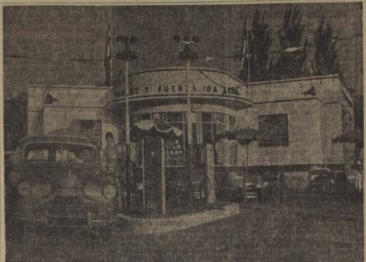
Servicentro Esso construido por la Esso Standard Oil Co., Chile, en la esquina de Avenida Isidora Goyenechea y El Bosque. Está llamado a prestar un positivo servicio al público automovilista de nuestro Barrio Alto. Con ocasión de su "puesta en marcha", se efectuó una ceremonia a la cual concurrieron autoridades y personalidades de diversos sectores.

La reunión que debía efectuarse ayer con este objeto, no pudo realizarse por ausencia de los representantes patronales.