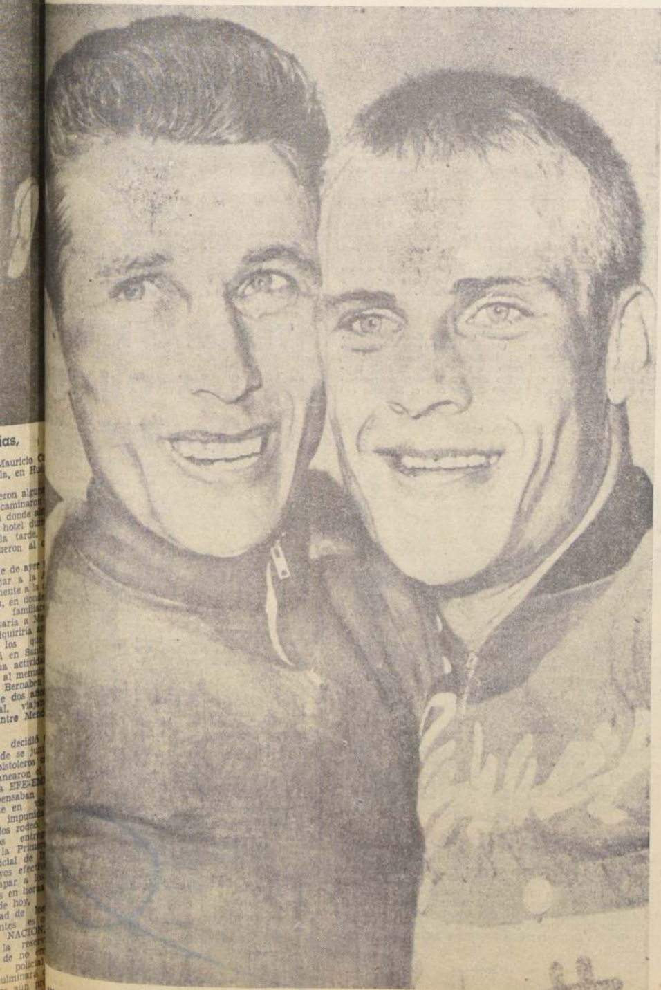
ANQUETIL, el más brillante pedalero francés de todos los tiempos, quien aparece acompañado del alemán Rudy Altig, animará una temporada internacional en Uruguay, siendo muy posible su venida a nuestro país.