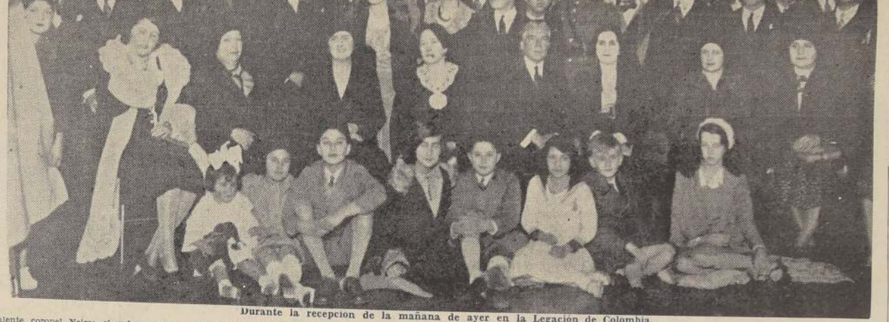
Durante la recepción de la mañana de ayer en la Legación de Colombia.

SALUDO AL MINISTRO DE COLOMBIA En la tarde de ayer pasó a la Legación de Colombia el excmo. de