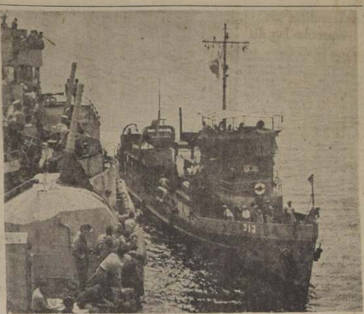
UNIDADES NAVALES BRITANICAS EN AGUAS COREANAS.— Barcos de guerra británicos han actuado contra los comunistas coreanos, sumándose a la guerra defensiva de la NU. Actúan con la 7a Flota Naval de los Estados Unidos.