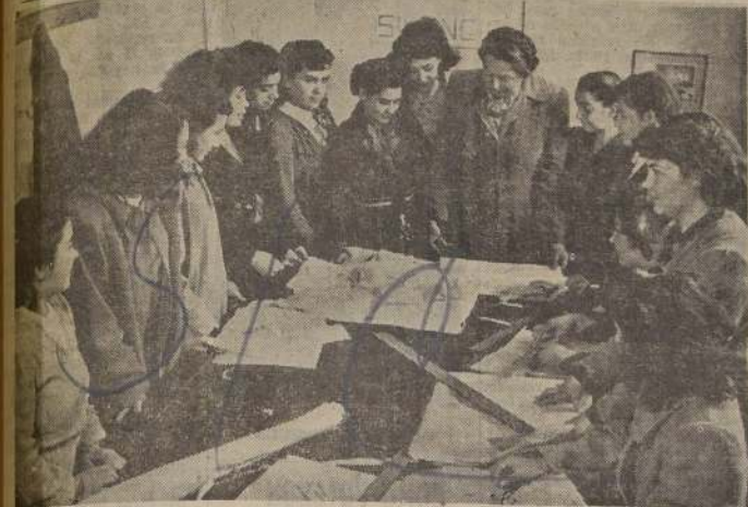
Grupo de alumnas del curso de Corte y Confección de las Escuelas Latino-Americanas, en los momentos en que rinden su examen final ante profesoras de este acreditado establecimiento educacional