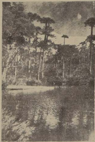
UN VERANEO IDEAL