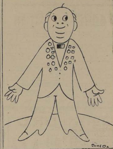
EL POBRE CIUDADANO.—¡Gracias, Dice mío