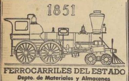
FERROCARRILES DEL ESTADO Depto. de Materiales y Almacenes