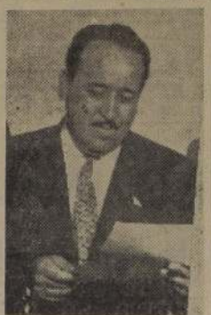
DIPUTADO por Colchagua, don Jorge de la Fuente, cuya preocupación por los problemas de esa provincia, se ha traducido en la destinación de fondos para la ejecución de importantes obras públicas en esa zona.

El Ministro de Obras Públicas, don Orlando Latorre, ha enviado una conceptuosa carta al diputado por Colchagua, don Jorge de la Fuente, dándole a conocer las obras de interés colectivo que los departamentos técnicos de esa Secretaría de Estado ejecutarán en esa provincia, haciéndose eco de la "permanente y patriótica preocupación por los problemas y necesidades de Colchagua" evidenciada por dicho parlamentario, y la cual —añota el señor Latorre— "ha permitido a este Ministerio un mejor conocimiento de tales asuntos, para resolverlos de la manera más conveniente".