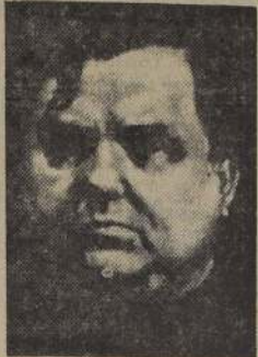
MALENKOV: Espera aprovechar el momento.

WASHINGTON, 16. (U.P.). — La Junta de la América Latina, que se reúne en la ciudad de Washington, se ha reunido hoy para discutir la posibilidad de que se realice una conferencia de la América Latina, que se celebraría en la ciudad de Washington, en el mes de octubre.