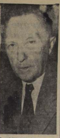
K. ADENAUER: Definición del Ejército Europeo.

La electricidad producida por ambas plantas servirá para suplir las necesidades de la zona noreste del país, donde el gran número de fábricas consume fuertes cantidades de electricidad.