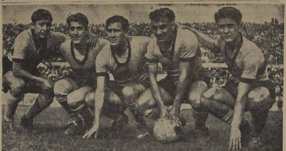
HACE DOS TEMPORADAS que Ferrobadminton viene rindiendo con los perfiles de los "grandes". En el campeonato anterior fue tercero y ahora bien puede ratificarlo. Está detrás de Palestino y la "U". Y mañana, precisamente, enfrenta en Nuñoa al team de colonia. Es un partido que puede resultar decisivo para las pretensiones de uno y otro. En la foto está la delantera ferrocarrilera de las más peligrosas del torneo. Y se cree que es la que saldrá mañana a la cancha. La integran Valenzuela, González, Lora, Casales y Alvarez.

Sin haber logrado una ubicación destacada, Universidad Católica ha estado jugando con regularidad en la segunda rueda. En la fecha anterior cayó ante Wanderers, pero fue en Playa Ancha, y por un escaso uno a cero. Lo que quiere decir que un cuadro que es capaz de ofrecerle una resistencia así a Wanderers en su propio e inhóspito terreno, bien puede pretender el triunfo ahora que se movió a su ambiente. Independencia ha sido siempre propicio a la "Católica" y a Audax le corresponde ahora medir esas posibilidades estudiantiles.