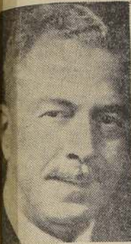
Señor Miguel Cruchaga Tocornal

Si, como se espera, pudiesen los Gobiernos de Chile y Argentina contar con la cooperación del Brasil, Estados Unidos y Perú, quedaría dentro de poco formalizada la mediación de los países limítrofes y los Estados Unidos, e iniciada una nueva gestión de paz".