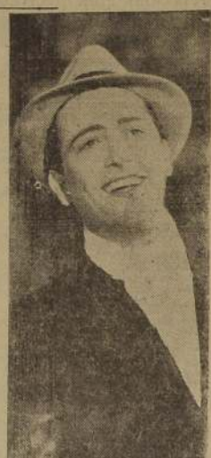
Hugo del Carril, celebrado intérprete del folklore argentino que se presenta mañana en los Teatros Victoria y Baquedano

Las entradas para las dos funciones de hoy como para las de mañana, están a la venta en las boleterías del Teatro, desde las diez de la mañana y pueden ser reservadas al fono 87630.