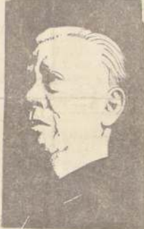
LIU SHAO CHI: Una hoja en la tormenta.