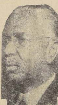
Sr. Pascual Ortiz Rubio

decisión del Presidente Ortiz Rubio se supo después de una dramática reunión del Gabinete, en la cual, según informaciones autorizadas, el Primer Mandatario informó al Ministerio que ya que no podía ejercer sus funciones en forma satisfactoria, no veía otra alternativa que su renuncia. (PASA A LA PAGINA OCHO)