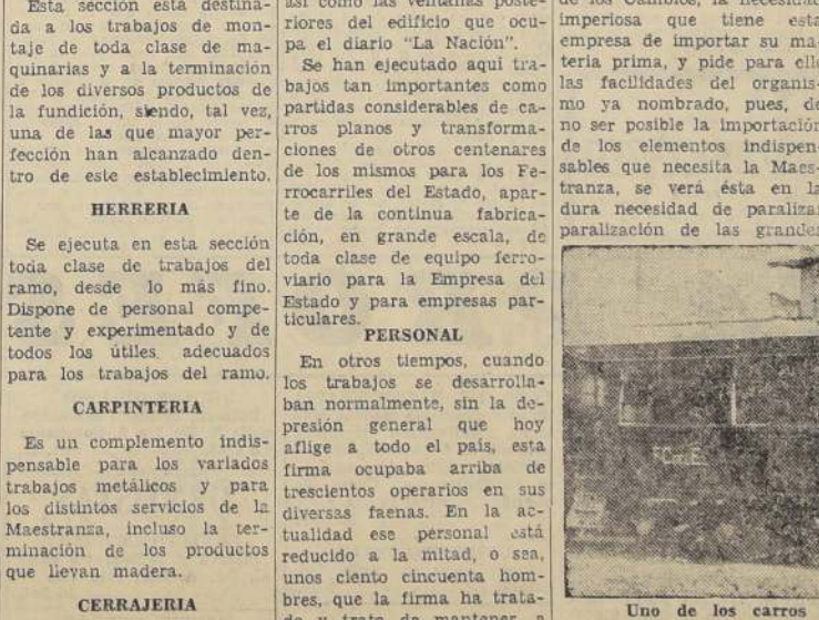
Fachada de la Maestranza Yungay, de los señores Heiremans Hnos. Ltda.

Vamos a detenernos ligeramente en cada una de las secciones que abarca la explotación de esta interesante industria, que debe ser ampliamente conocida y estimada, por el factor importante que representa dentro del progreso nacional y la fuerza económica del país. CALDERERIA Es otra de las secciones importantes, dedicada a las