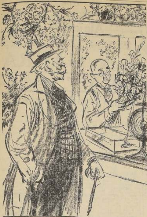
—Le parece que si le envío esas flores llegará a verme?—