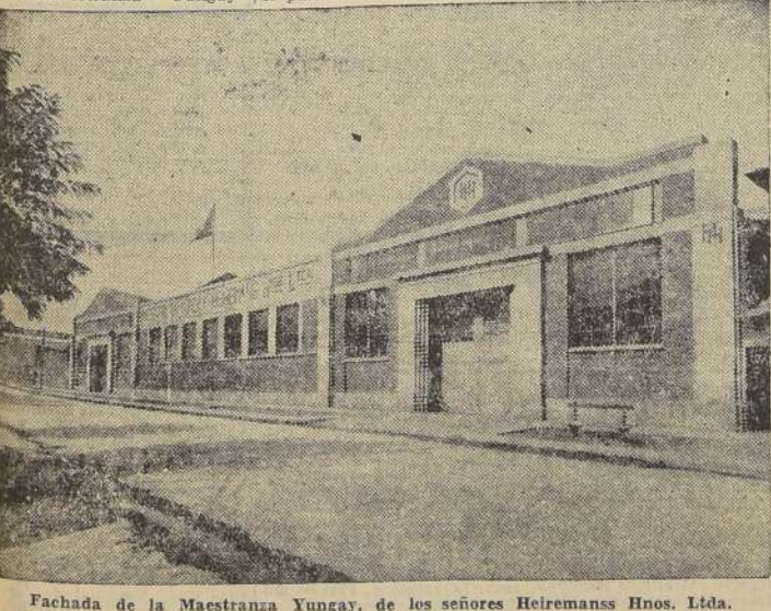
Fachada de la Maestranza Yungay, de los señores Heiremans Hnos. Ltda.

La importancia de esta industria, como puede verse por lo expuesto, y el factor que representa dentro de la economía nacional, la hacen acreedora a la más franca protección de los Poderes Públicos, en sus justas peticiones de facilidades para importar la materia prima que necesita para mantener sus trabajos. Dentro del período de extraordinario mal estar por que atraviesa el país, se debe, en primer lugar, prestar atención a las grandes empresas que laboran tesoneramente la riqueza pública y privada. La firma Heiremans Hnos. Ltda., que gira con un capital de $ 1.100.000, aparte de la importancia de los trabajos que ejecuta, merece esta protección, o más bien, facilidades para poder importar los elementos básicos que le son indispensables para seguir los trabajos, ya que