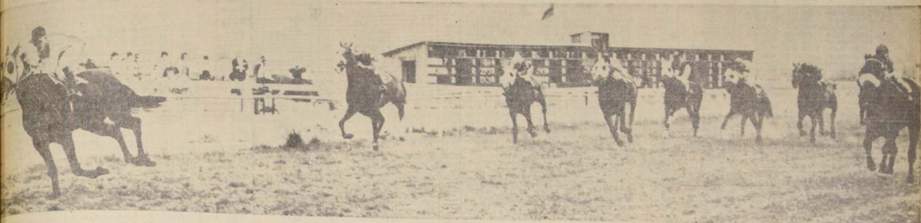
DIPLOMATICO logró el primer triunfo clásico de su campaña. El pupilo de Vadanovic ha progresado y confirma la buena impresión que se tuvo de él desde sus primeras presentaciones. La victoria en el "España" es la cuarta de su campaña. Su escoltador más cercano —también en una buena actuación— fue Flotador, mientras más atrás terminaban Salidor, Académista, Bauru y Caracal. Lo dirigió Ernesto Guajardo.