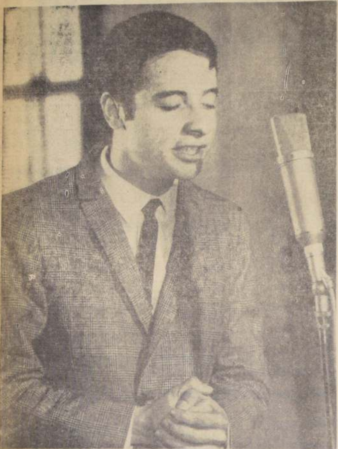
JOSE ALFREDO FUENTES, el astro chileno de la canción que ha llegado a la cúspide de la fama