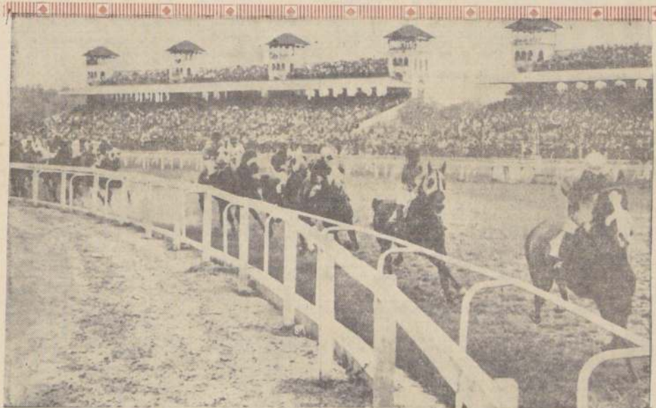
ASI PASARON POR PRIMERA VEZ frente a la meta los animadores del premio "España". Señala el camino Salidor, mientras a dos cuerpos le sigue Diplomático, quien tiene a Bauru en el lugar siguiente. Los punteros en la pista N° 2 se vieron muy favorecidos.

tras paulatinamente se iba quedando en el último lugar Silvino. Al puntero siempre le escoltaban Diplomático, Bauru, Cuadrápangue, Flotador, Académista y Perugino. Al ingresar a los últimos 1.000 metros de recorrido, salidor actuaba al frente con tres largos sobre Diplomático, Cuadrápangue, Bauru, Flotador, Académista, Perugino, Caracal, El Alamo, Centinela y Silvino. Al girar el "codo" final Diplomático se fue acercando hasta llegar al lado del puntero Salidor. Entraron a la recta final en una línea, pero Diplomático y Salidor estuvieron compartiendo ese lugar por corto trecho, ya que definitivamente al frente se quedó Diplomático quien, estimulado por su látigo se fue adelante y tomó ventajas. Restando unos 250 metros surgió con energías Flotador. Dominó a Salidor, pero debió conformarse con el segundo puesto ya que Diplomático al frente con una ventaja de tres cuerpos terminó el recorrido en el primer lugar. Flotador, al ser segundo, sacó un cuerpo tres cuartos a Salidor, mientras completaba el marcador Académista a un cuerpo y medio. Los otros lugares para Bauru, Caracal, Perugino, Cuadrápangue, Silvino, El Alamo y Centinela.