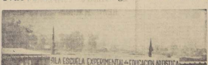
LA ESCUELA EXPERIMENTAL DE EDUCACION ARTISTICA

Entregada a sus vecinos de La Reina y agradece al señor Sub-Secretario y señor Ministro de Educación, como asimismo a las autoridades Municipales de la Comuna las gestiones realizadas en favor de la inauguración de este plantel a la Comuna de La Reina.